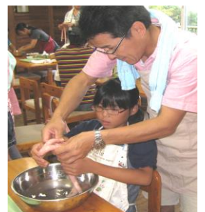
↑ソーセージ作りの様子